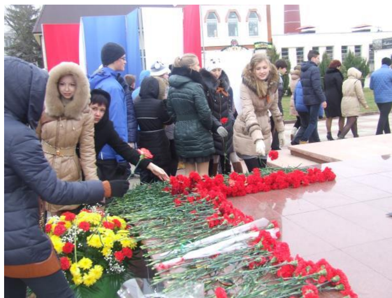
Возложили цветы к Обелиску Славы